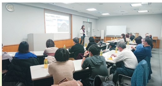
ゼロノワ不動産でも随時セミナーを開催

「空き家」の問題は家そのものの問題よりも、関わる「人」の問題であることが圧倒的。「まだ元気だから」ではなく、「元気なうちに」家族で今後について考えておくことが大切です。「売るかどうか決まっていないと、相談に乗ってくれないのでは」と思う方もいらっしゃると思います。当社では売却以外にも借り上げ(当社で空き家を借りて、別の