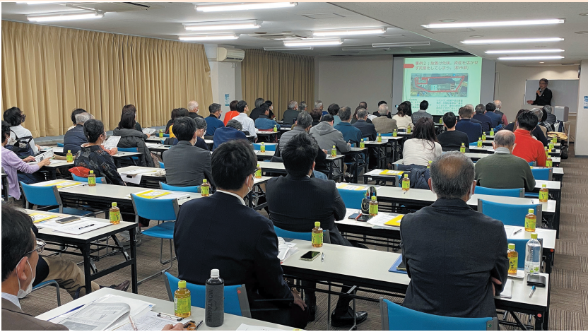
不動産終活支援機構が開催しているセミナーの様子

不動産の終活を進めるためには①所有不動産の把握②所有不動産の整理③相続後の分配④相続の決定⑤相続を基に遺言書の作成を勧められています。さらに家族での話し合いが重要です。