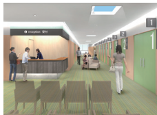
1階ドック待合（パース図）