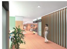
3階女性フロア待合（パース図）

これまでの施設は協会事務所とがん検診センター（2代目）の機能が一体となり、1981年に2階建てで完成、89年に3階建てに増築し