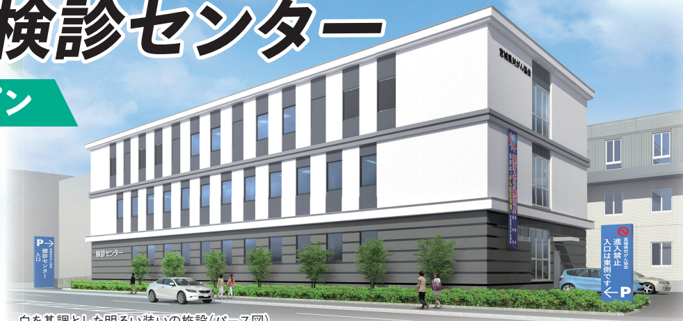
白を基調とした明るい装いの施設（パース図）

仙台市青葉区上杉にある公益財団法人宮城県対がん協会の敷地内に建設したがん検診センターがこのほど完成し、4月にオープンします。同協会は1958年、全国に先駆けて設立された民間主導のがん征圧を推進する団体です。設立10年後には、こちらも全国に先駆け、がん検診センターを開設。脈々と受け継がれてきた歴史がこの春、新たなステージで未来を刻んでいきます。