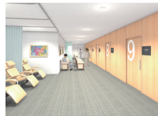
2階内視鏡前処置室（パース図）